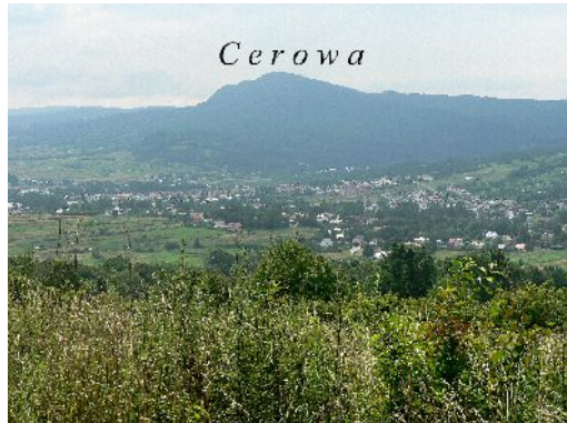
Dukla s kóty 534