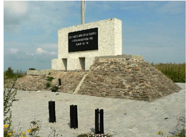
Památník vojákům, padlým na kótě 534